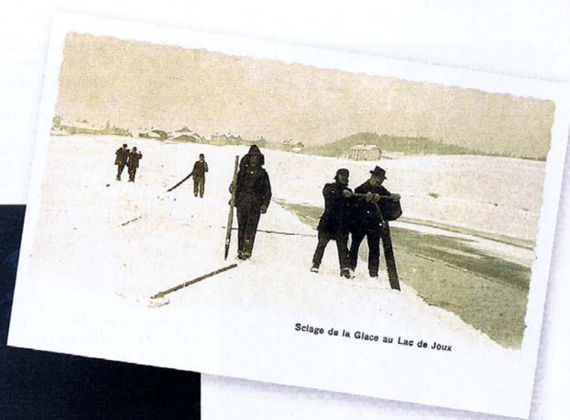
Sciage de la Glace au Lac de Joux