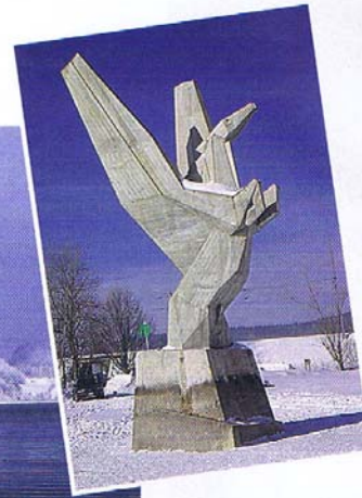
La statue de Pégase, cheval ailé de la mythologie grecque, érigée en 1956 par les Forces de Joux sur la commune du Pont.